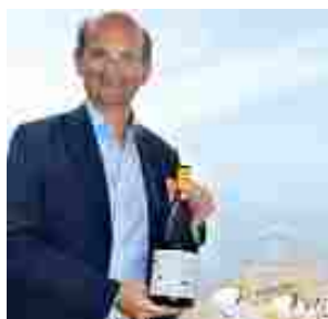
Frescobaldi , continua e si rafforza il progetto Gorgona