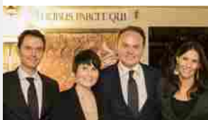
Samantha Cristoforetti a Villa Margon